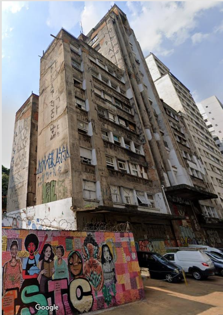
OCUPAÇÃO 9 DE JULHO 123 FAMÍLIAS