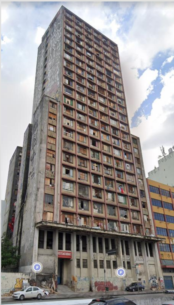
OCUPAÇÃO PRESTES MAIA 368 FAMÍLIAS